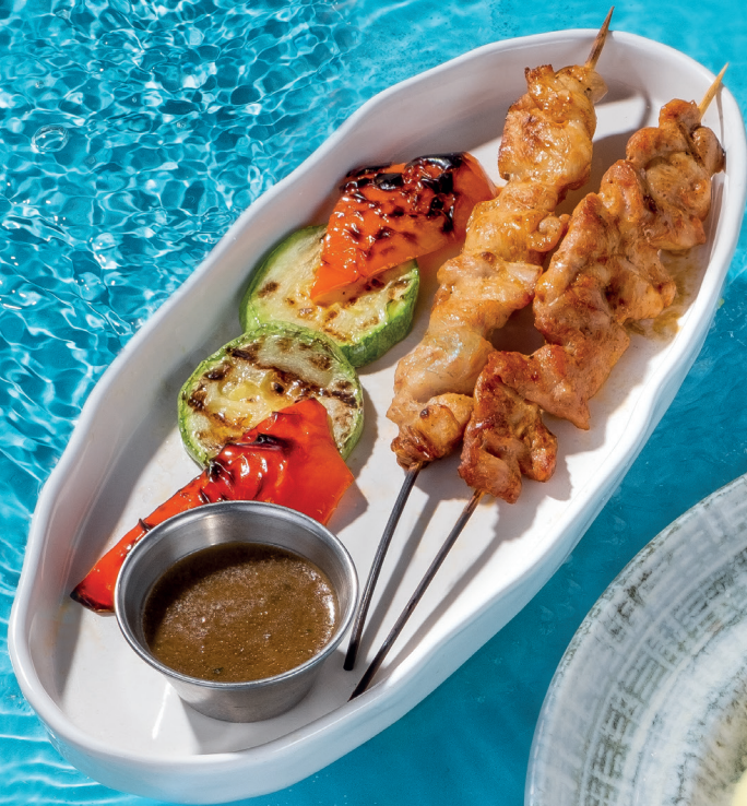
КУРОЧКА КУСИЯКИ 90/40/25г 270