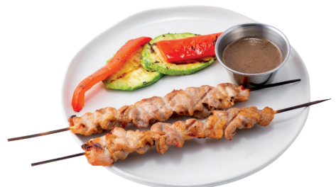
СВИНИНА КУСИЯКИ 90/40/25г - 250 -