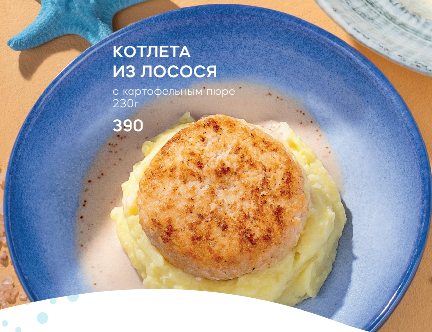
КОТЛЕТА ИЗ ЛОСОСЯ с картофельным пюре 230г 390