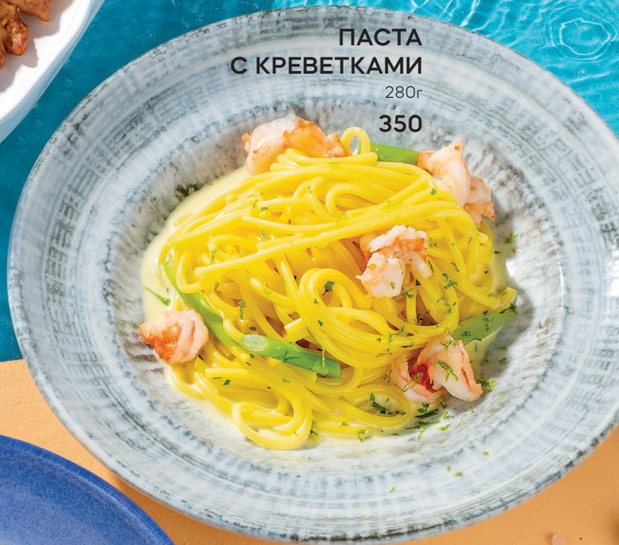
ПАСТА С КРЕВЕТКАМИ 280г 350