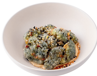
БРОККОЛИ ФРИ 190г - 210 -